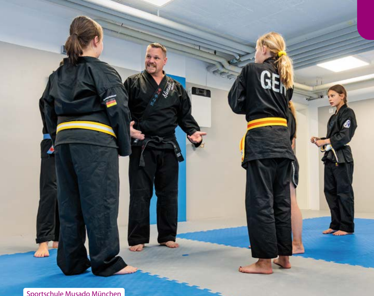
Sportschule Musado München