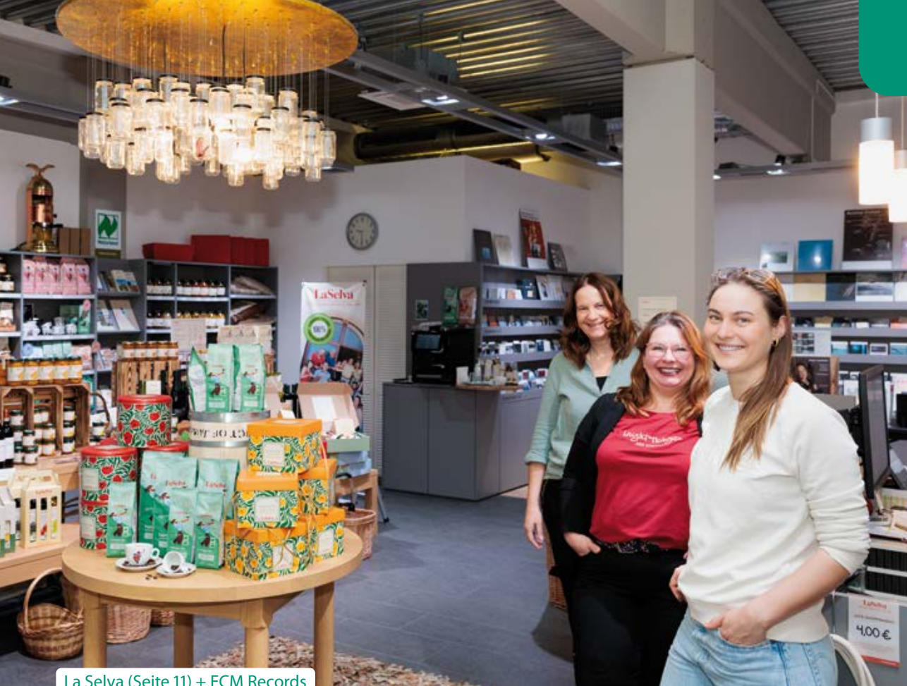
La Selva (Seite 11) + ECM Records