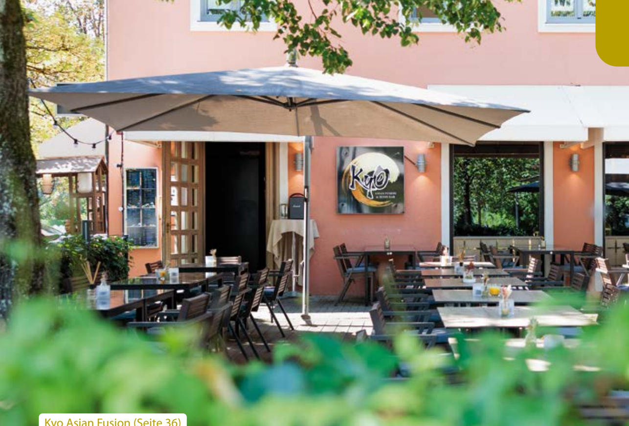
Kyo Asian Fusion (Seite 36)