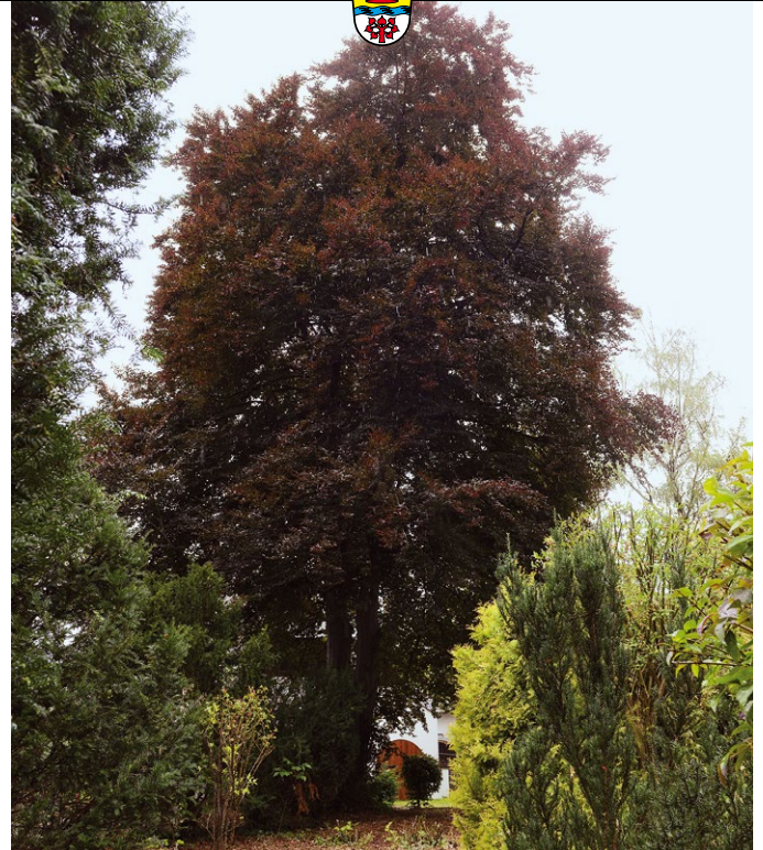
Diese Rotbuche in der Lindenstraße konnte dank der Zusammenarbeit von Grundstücksbesitzer und Gemeinde erhalten werden.

Bei schwierigen Abwägungen, vor allem bei besonders erhaltenswerten Baumarten wie Eichen, Linden, Ahorn, Ulmen, Eschen, Buchen oder Waldkiefern , entscheidet entweder der Ausschuss für Überörtliche Angelegenheiten und Umweltfragen oder der Bauausschuss über den Fällantrag.